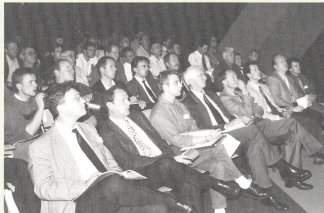
Le public attentif et nombreux de la journée du 17 mai

souci d'offrir à tous ses membres des prestations correspondant aux besoins de chacun a décidé, il y a une année, de prévoir des journées d'information ciblées sur les intérêts des professionnels de la branche