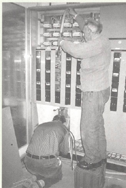
Die Arbeit zu zweit verhinderte mit grosser Wahrscheinlichkeit den Tod. Le travail à deux a très probablement empêché des suites mortelles.

Les deux monteurs ont décidé de libérer un départ G2 et de commuter le câble libre-