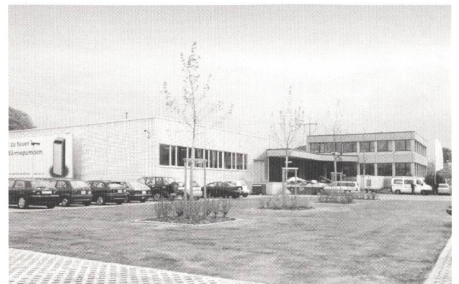
Betriebsgebäude der CTA in Münsingen.

nach seinen Produkten reagieren. Durch einen Anbau wurde die bisherige Produktions- und Lagerkapazität verdoppelt. Die Fertigstellung des Neubaus fällt mit dem 20. Firmenjubiläum zusammen.