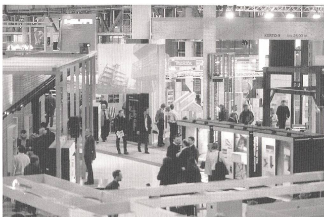
Im Jahr 2001 besuchten 104 167 Besucher aus der ganzen Schweiz und dem angrenzenden Ausland die Fachmesse in Basel.

Wolfgang Feist, der Initiant des Passivhauskonzeptes, und Dietmar Eberle, Architekturprofessor an der ETH Zürich, sind im Referententeam, das rund 45 Fachleute aus allen Sparten des Bauens umfasst. Auffallend ist der stattliche Anteil von Referenten und Referentinnen aus Deutschland und Österreich.