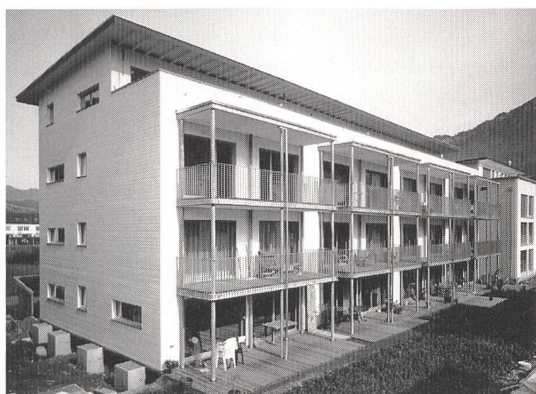
Passivhaus nach Schweizer Art in Stans (Bild: Oerlikon Journalisten).