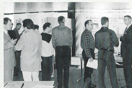
Die Tagung vom 30. Oktober 2001 in Rapperswil mit angegliederter Ausstellung verschiedener Hersteller von Bus-Systemen war eine der bestbesuchten Veranstaltungen des letzten Jahres