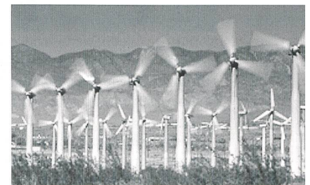
Bald 10 000 MW Windkraft in Deutschland.

(rw) Die Windkraft hat sich im ersten Halbjahr 2002 in Deutschland so rasant wie nie zuvor entwickelt. Neu wurden 828 Windräder mit einer Gesamtleistung von 1087 MW errichtet. Ende Juni 2002 waren damit bundesweit nahezu 12 250 Windräder mit einer Gesamtleistung von etwa 9840 MW installiert. Damit lassen sich in einem normalen Windjahr über 3,5% des deutschen Stromverbrauchs decken.