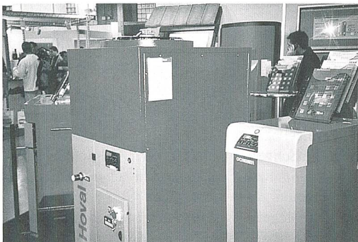
Wärmepumpen an der Minergie-Messe 2001 in Bern.

Das Ziel von Energie-Schweiz, bis ins Jahr 2010 rund 120 000 Wärmepumpen zu installieren, ist folglich nach dem heutigen Stand erreichbar. Vorsichtige Berechnungen des Bundesamts für Energie haben gezeigt, dass theoretisch der gesamte Heizbedarf der Schweiz mit Umgebungswärme gedeckt werden könnte.