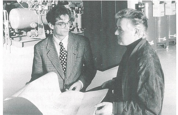
Investitionen in die Kundenbindung (Beratung).

(mp) Energieversorger verdienen in den nächsten Jahren im europäischen Markt vor allem am Stromverkauf an Privathaushalte – er wird zur wichtigsten Einnahmequelle der Branche. Beim Grosshandel mit Strom sind die Gewinnmargen nur niedrig. Stromerzeugung und -übertragung gelten ebenfalls als wenig lukrativ. Knapp ein Fünftel der Strommanager erwartet bei der Übertragung überhaupt keinen Gewinn. Bei der Stromerzeugung sind Profite nur noch mit abgeschriebenen Kraftwerken möglich. Die Folge: Die Energieversorger wollen durch den Zukauf von Stadtwerken näher an den Verbraucher. Das professionelle Kundenmanagement wird intensiviert. Drei Viertel der Unternehmen investieren bis 2004 in die Kundenbindung. Zu diesem Ergebnis kommt der «Branchenkompass Energieversorger», eine Studie aus Deutschland von Mummert + Partner, dem F.A.Z.-Institut und dem Manager Magazin.