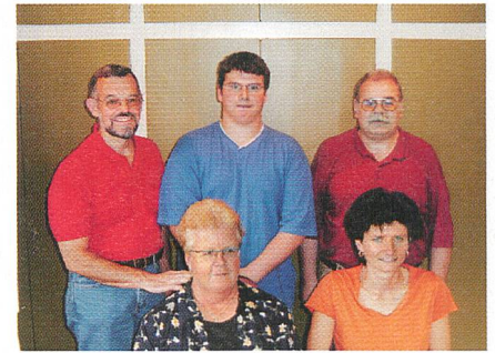
Projektteam EW Tamins.

Im März 2001 wurde die Evaluation eines neuen Finanz- und Abrechnungssystem gestartet. Der Systementscheid Simultan und easy erfolgte im Mai. Seit 1. Januar 2002 wird das System produktiv genutzt. Dank der übergeordneten Projektleitung durch die Firma EbOT AG und der guten Kooperation der gewählten Partner (easy AG, Simultan AG) konnte das Projekt im budgetierten Zeit- und Kostenrahmen realisiert werden.