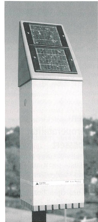
Permanente Überwachung mit dem Narda Area Monitor System 2600. Gut sichtbar sind die Solarzellen für die unabhängige Stromversorgung

Narda Safety Test Solutions schafft mit dem Narda Area Monitor System 2600 völlig neue Möglichkeiten zur permanenten und flächendeckenden Überwachung elektromagnetischer Felder. Das System ermöglicht die permanente und vollautomatische Fernüberwachung und Analyse elektromagnetischer Felder in der nahen und fernen Umgebung von Sendeanlagen oder anderen Quellen elektromagnetischer Strahlung. Messergebnisse können fern abgerufen, über lange Zeiträume gespeichert und statistisch ausgewertet werden. Das System wird drahtlos per PC oder Mobiltelefon fernbedient, ebenso können verantwortliche Personen alarmiert werden. Die besonders hohe Messempfindlichkeit der Sonden bis 18 GHz liefert auch bei schwachen Feldstärken verlässliche Ergebnisse. Mit dieser Neuheit richtet sich Narda STS insbesondere an die Behörden von Bund, Ländern und Gemeinden und an die Betreiber von Telekommu-