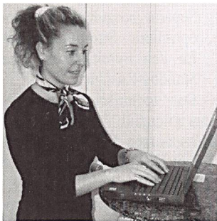
Drahtlose Kommunikation über das Public Wireless LAN ermöglicht einfachen Zugriff auf die Daten im Büro.

Weitere Standorte werden laufend erschlossen, die aktuelle Liste im Internet ( www.swisscom-mobile.ch ) wird wöchentlich aktualisiert: bis Ende 2003 soll die Anzahl auf 250 Standorte erweitert werden.