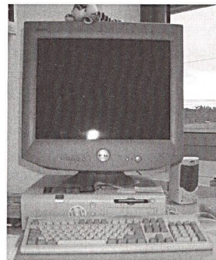
Rund ein Drittel des Stromverbrauchs liesse sich durch das Ausschöpfen des technischen Stromeinsparpotenzials bei PCs einsparen.

Anforderungen an den maximalen Leistungsbezug der Geräte im Bereitschafts-, Standby- und Aus-Zustand. Ferner sollten ähnliche Anforderungen für den Leistungsbezug im On-Zustand ausgearbeitet werden. – Quelle: Forschungsprogramm Elektrizität, www.electricity-research.ch