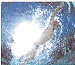
Keimfrei dank UV-Strahlung: eine neue Pool-Beschichtung macht Chlor überflüssig

In Zukunft wird man Freibäder ohne Chlor reinigen können. Wie National Geographic in seiner neusten Ausgabe berichtet, haben Forscher von der Technischen Universität Darmstadt eine Folie für Poolbecken entwickelt, die dank Sonnenlicht für ein keimfreies Baden sorgt. Die Folie wird mit einem für Menschen unschädlichen Lack beschichtet, der Metalloxidpartikel enthält. Die hereinfallende UV-Strahlung löst auf dieser Beschichtung einen photochemischen Prozess aus: die