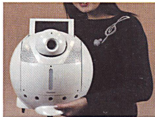
Folgsam wie ein Hündchen: der ApriAlpha von Toshiba

diener mit Überwachungsfunktion. So kann etwa der bereits für 2313 Euro erhältliche «Maron-1» des Unternehmens Fujitsu nicht nur das Haus überwachen und bei einem Einbruch Alarm schlagen, sondern auch als Telefon benutzt werden. Der von Sanyo entwickelte «Flatthru» ist noch intelligenter: er hört nicht nur auf vokale Befehle, sondern kann auch Getränke selbst auf unebenem Boden servieren, ohne sie zu verschütten. Da Flatthru aber noch nicht bereit ist für den Handel, hat sich Sanyo mit der Roboterfirma Tmsuk zusammengetan, um den für 15490 Euro erhältlichen «Banryu» zu vertreiben. Der vierbeinige Banryu mit der länglichen Schnauze trägt auf dem Rücken eine Videokamera. Er spürt Einbrechern nach und alarmiert die Hausbesitzer via Handy, auf das