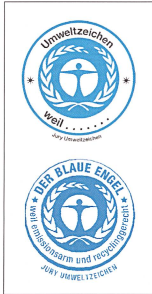
Altes (oben) und neues (unten) Emblem des Blauen Engels – unten bereits mit der Umschrift für die Drucker ausgestattet.

Der Blaue Engel wird vom Umweltbundesamt (UBA, Berlin) vergeben.