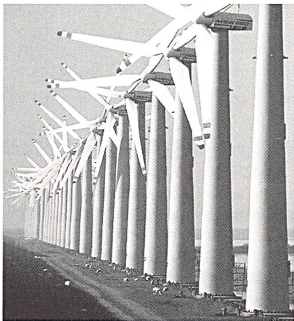
Windkraft an der deutschen Nordsee: beginnende Sättigung der Bevölkerung.

Die Europäische Kommission wird nun auf der Grundlage der NABU-Beschwerde die Einleitung eines Vertragsverletzungsverfahrens gegen die Bundesregierung prüfen. Unselt bemängelte die ungenügende Steuerung der Offshore-Planungen insgesamt. Letztlich erhoffe sich der NABU von der Beschwerde auch eine Signalwirkung auf andere Windparks, die in kritischen Bereichen geplant seien. «Wir brauchen eine neue Steuerung des Ausbaus der Offshore-Windenergie, bei der der Naturschutz ausreichend berücksichtigt wird.»