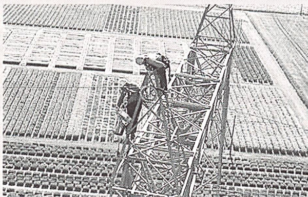
Mitarbeiterzufriedenheit als immaterieller Vermögenswert.