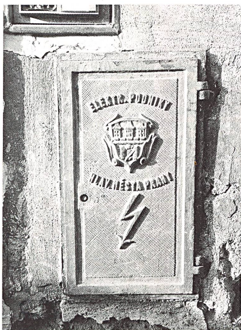
Bereits seit 1995 gibt es eine enge Kooperation zwischen der UCTE und den Netzbetreibern im Osten (Verteilkasten in Prag).

(ee/vö) Die UCTE (Union for the Coordination of Transmission of Electricity) hat den gegenwärtigen Stand der technischen Voruntersuchung für eine Synchronisierung des UCTE-Systems mit dem Stromübertragungssystem der GUS und der baltischen Staaten vorgestellt. Vorläufige Ergeb-