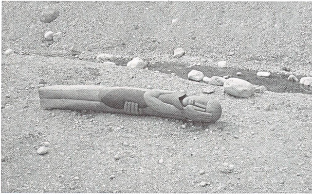
Der Gewässerpreis 2003: eine Statue eines liegenden Menschen mit einem Fisch im Arm liegt im wieder geöffneten Bach in Oerlikon.