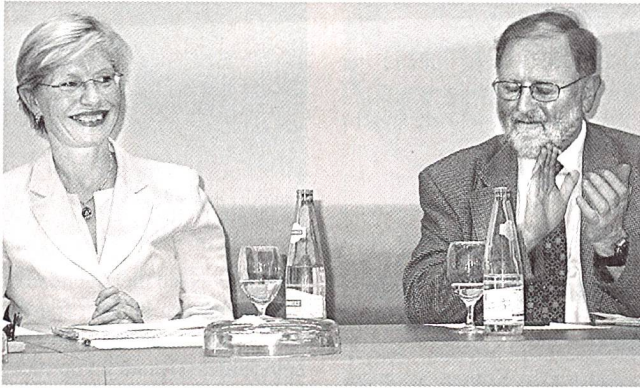
Die Nationalrätin und Zürcher Regierungsrätin Regine Aeppli, zurücktretende Präsidentin der Agentur für erneuerbare Energien und Energieeffizienz, mit ihrem Nachfolger, Nationalrat Odilo Schmid (Bild: AEE).