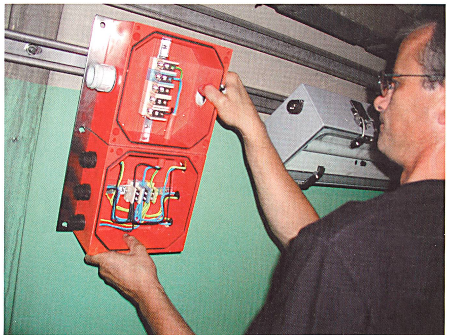
Bild 3 Montage einer Doppelabzweigdose und Notleuchte für Autobahnstrassentunnel, obere AZ-Dose zur Schlaufung, untere zur Lampenanspeisung.

Deshalb müssen solche Einrichtungen eine hohe Funktionssicherheit auch im Brandfalle gewährleisten. Brandfeste Elektroinstallationen werden in Zukunft