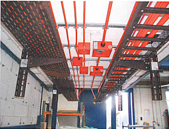
Bild 4 Prüfanordnung von Kabel, Abzweigboxen und Kabelkanälen für Brandtest/Funktionserhalt E30.