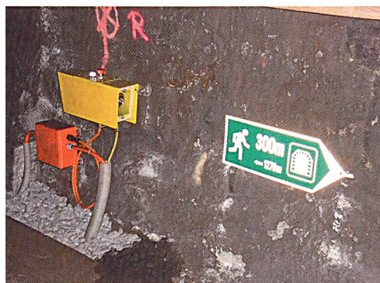
Bild 2 Steckbare Notbeleuchtung in Eisenbahntunnel mit brandfester Anschlussdose und Verkabelung sowie Fluchtwegweiser mit Distanzangabe zum nächsten Notausgang.

Adresse des Autors Ernst W. Haltiner Beratender El.-Ingenieur/Fachredaktor Postfach 263 9450 Altstätten