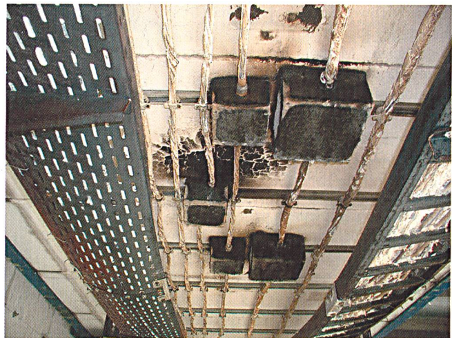
Bild 5 Anordnung wie Bild 4 nach erfolgreichem Brandtest nach DIN 4102.

zwingend zur Grundforderung in Tunnels und Gebäuden sowie Einrichtungen mit hoher Personenbelegung und begrenzten Fluchtmöglichkeiten wie zum Beispiel in Hochhäusern, Büros, Spitälern, Tunnels für Bahnen und Strassen, Flughäfen, aber auch bei hohen Konzentrationen von Sachwerten, wie EDV/Computeranlagen, Museen, Chemie, Offshore-Industrie.