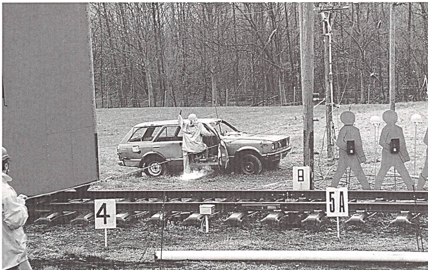
Demonstration in Préverenges.