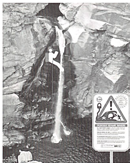
Die Maggia Kraftwerke AG (Ofima) und die Blenio Kraftwerke AG (Ofible) im Tessin warnen mit diesen Bildern auch im Internet vor Schwallwasser.

Union Suisse des Installateurs-Electriciens (USIE), Formation professionnelle HP, Case postale 2328, 8031 Zurich, e-mail: m.descloux@vsei.ch.