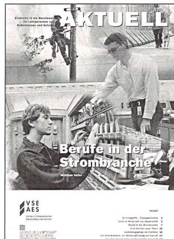
Nützliche Berufsbroschüre für Lehrlinge und Studenten.

Strom 2003, Electricité 2003, Elettricità 2003, VSE, Hintere Bahnhofstr. 10, 5001 Aarau, Tel. 062 825 25 25, Fax 062 825 25 26, Fr. 2.90 (Spezialpreis ab 100 Ex.) für VSE-Mitglieder; Fr. 3.90 für Nichtmitglieder, www.strom.ch.