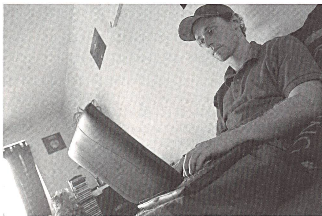
Die ersten 6 Monate Betrieb von www.tschau.ch zeigen: Jugendliche nutzen rege die individuelle Internet-Beratung.

Über die Hälfte der Fragesteller kam aus den Kantonen Aargau (rund 110), Zürich (rund 100) und Bern (rund 80), wobei beinahe zwei Drittel weiblichen Geschlechts waren. Der Schwerpunkt der Fragen betraf die Sexualität (40%) und Beziehungsprobleme (25%). Nur gerade 4% der Fragen drehten sich um das Thema Schule. – Quelle: www.tschau.ch