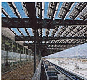
Gebäudeintegrierte Photovoltaik-Beschattungsanlage Dock Midfield Zürich Flughafen

Weiter können auf der Homepage Details der einzelnen Projekte und mit den