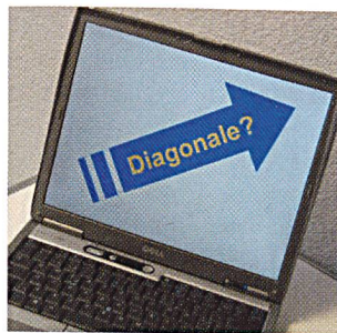
Dank reduziertem Preisgefälle: Immer mehr Notebooks werden mit 15-Zoll-Monitoren ausgerüstet

Bei Auftragsfertigern wie Uniwill Computer, der sich auf den europäischen Markt konzentriert, machen die grösseren Monitore heute schon 80 bis 90% sämtlicher Auslieferungen aus. – Quellen: www.digitimes.com , www.uniwill.com