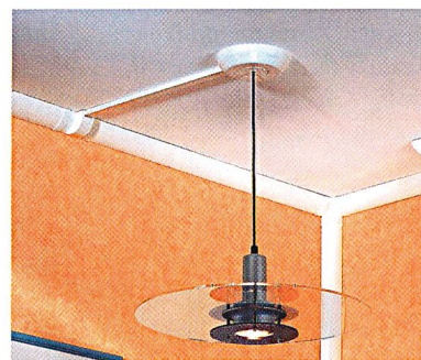
SL-Eckkanalsystem von Tehalit

Bei Umbauten und Erweiterungen bietet sich das SL-Eckkanalsystem von Tehalit als Lösung an. Es erlaubt, Elektroleitungen in den Ecken eines Raumes und entlang der Decke so zu verlegen, dass praktisch jede Stelle eines Raumes