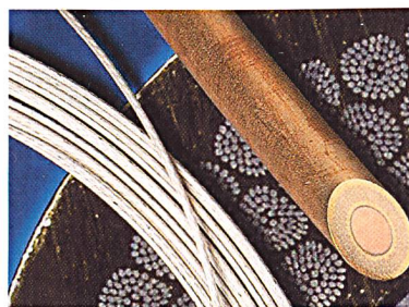
Supraleitender Draht von Supercon Inc. in verschiedenen Ausführungen

Sie sind bei einer Übergangstemperatur von 16 – 18 K im Hochmagnetfeld für Anwendungen von >10 Tesla geeignet. Der isoliert oder nicht isoliert erhältliche Leiter wird in verschiedenen Konfigurationen und Grössen von 0,5 bis 1,25 mm Durchmesser angeboten und auf Spulen geliefert. Er ist für das Wickeln von Magnetspulen sowie Forschung und Entwicklung geeignet; die Lieferzeit beträgt 6 bis 8 Wochen.