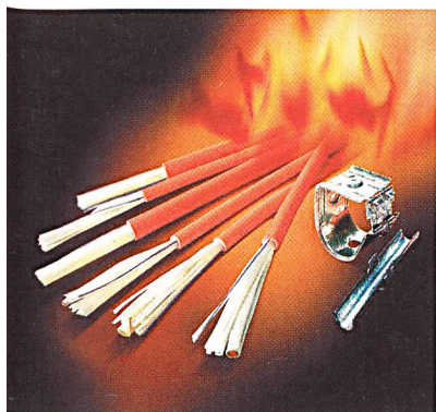
Optofil-Safety-Kabel von Daetwyler sind im Brandfall während 30 min funktionsfähig

Für den Einsatz in Strassen- und Bahntunnels sowie in Geschäftshäusern hat die Dätwyler Kabel+Systeme mit Optofil Safety eine neue Glasfaser-Systemlösung entwickelt, die erstmals den Funktionserhalt einer optischen Datenübertragung über maximal 30 Minuten garantiert. In Verbindung mit den bewährten Pyrofil-Kabeln und Pyrofil-Systemkomponenten