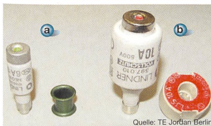
Bild 4 Sicherungen D01 (a) und DII (b) mit entsprechenden Adaptern

hentliches Berühren einer Spannung führenden Ader mit dem geerdeten Gehäuse eines Schutzklasse I-Gerätes zu Störlichtbögen führen kann.