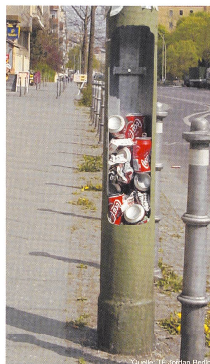
Bild 1 Zweckentfremdung der Lichtmasten

Für Leuchten gilt die Norm EN 60598 2) . Eine Leuchte, die diesem Standard entspricht, darf die ENEC-Marke 3) (Bild 2) tragen, die durch eines von 25