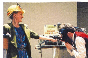
Duo Hugentoblers witzige Unterbrüche (Bilder: bfe, Joël Schweizer, Büro Cortesi Biel).

Weizsäcker warnte insbesondere vor einer «Emissionsverlagerung» im Fall einer Verteuerung des CO 2 -Zertifikats-Handels: «Kommt es zu diesen Verlagerungen, dann schaffen diese in den Nicht-Kyoto-Staaten den perversen Anreiz, gerade nicht dem Kyoto-Abkommen beizutreten, um diese Industrie-Verlagerung zu fördern. Der Sinn der Kyoto-Selbstverpflichtungen wäre konterkariert.» Die Schweiz, so von Weizsäckers Fazit, sollte sich deshalb auf einen niedrigen CO 2 -Preis einstellen.