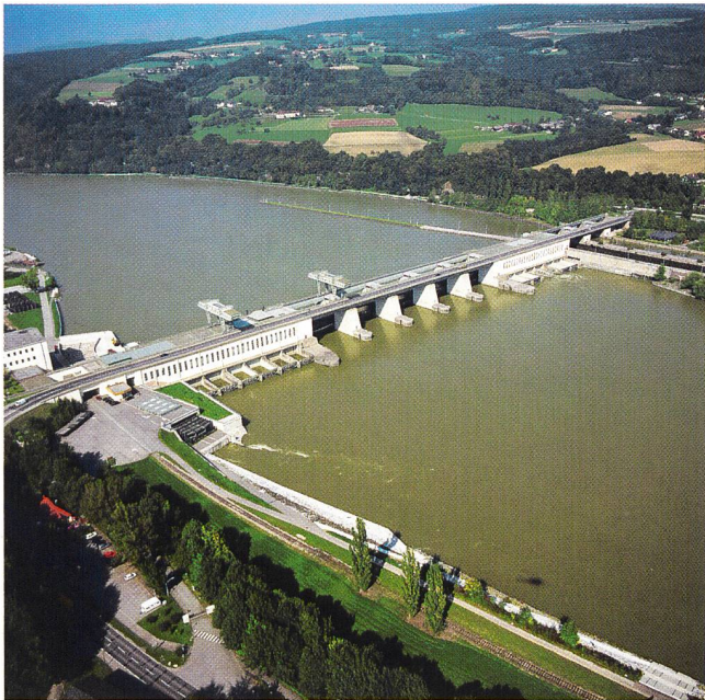
Der Verbund-Konzern verzeichnet trotz historisch niedriger Wasserführung gute Ergebnisse (im Bild das Verbund-Donaukraftwerk Ybbs-Persenbeug).