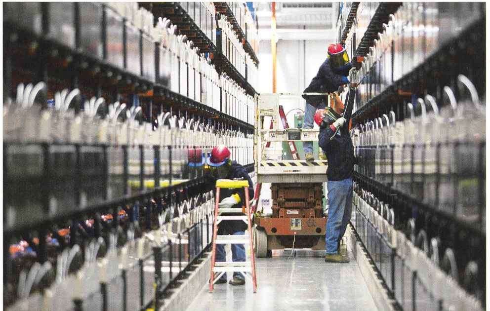
Starkest Kerngeschäft Energie: weltgrößtes Batteriespeichersystem in Alaska.

steigern. Das Netz sollte New York mit Elektrizität versorgen. Nun droht der Stadt ein neuer Blackout, da die Interessenten absprangen. Bis zum Jahr 2008 benötigt New York 2600 Megawatt zusätzliche Leistung. Das neue Versorgungsnetz, die so genannte Empire Connection Line des Konzerns Conjunction LLC, sollte Abhilfe schaffen.