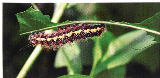
Raube: Wandlungsfähigkeit bis zum freien Flug.

Detailergebnisse aus der Benchmarkstudie «Organisatorische Wandlungsfähigkeit» können über www.e-comes.de angefordert werden.