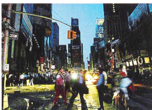
Blackout in New York?

(gs) Das amerikanische Unternehmen Conjunction wollte auf einer Auktion den Zugang zu seinen neuen Stromleitungen an Energiekonzerne ver-