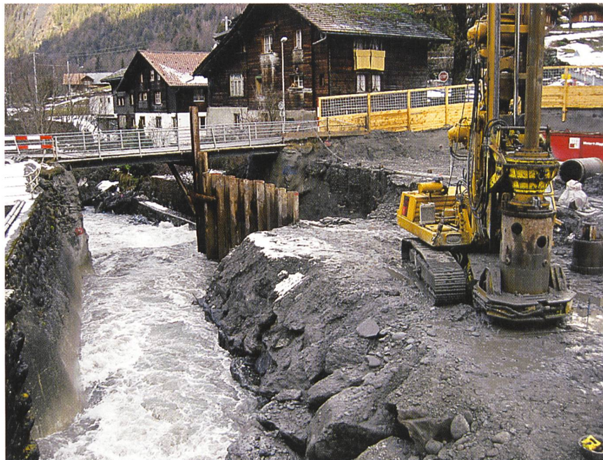
Baugrube «Wehröffnung links»: Vorbohren im grobblockigen Flussgrund für das Einvibrieren der Spundbohlen.

Die aktuelle konzessionierte Staukote beim Wehr wird auch inskünftig be- behalten. Die Entnahmemengen bleibt mit 6 m 3 /s ebenfalls unverändert. Das neue Wehr erlaubt die gefahrlose Abfuhr eines 1000-jährlichen Hochwas- sers – entsprechend rund 160 m 3 /s – selbst wenn nur eine Wehröffnung in Be- trieb ist.