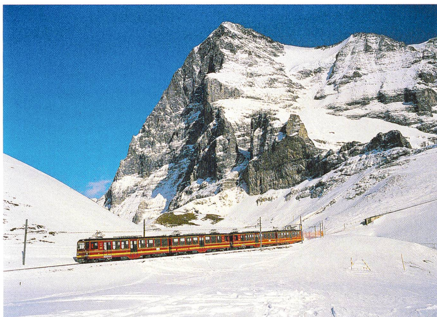
Die Jungfraubahn bezieht ihren Bahnstrom aus dem eigenen Kraftwerk an der Lüttschine.