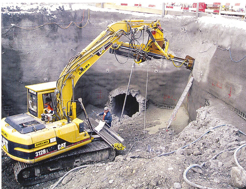
Baugrube «Entsanderbecken»: Erstellen der Nagelwand am Ende des künftigen Entsanderbeckens (Stolleneinlauf).

Die gesamte Bau- und Montagezeit dauert rund anderthalb Jahre. Mitte Juni 2005 soll die neue Wehr- und Fassungsanlage definitiv in Betrieb genommen werden.