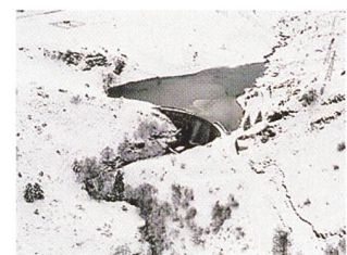
Barrage de Castillon (Pyrénées).

Le résultat net courant s'élève à 1981 millions d'euros. Il a été multiplié par près de 8 par rapport au 31 décembre 2002 (pro forma), témoignant d'une très bonne performance opérationnelle et d'une marge de manœuvre financière renforcée. Le résultat net part d'EDF est en forte croissance à 857 millions d'euros au 31 décembre 2003 contre 231 millions d'euros au 31 décembre 2002 (pro forma).