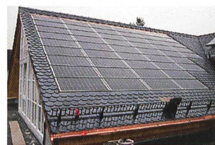
Indachsystem (5,4 kW).

mit der Solrif-Indachlösung realisiert. Eines dieser Objekte wurde im Rahmen des Schweizer Solarpreises 2003 ausgezeichnet.