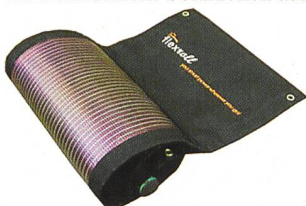
Flexibles Solarladegerät.

(no) Die an der IMT (Universität Neuenburg) entwickelten Dünnschicht-Solarzellen auf