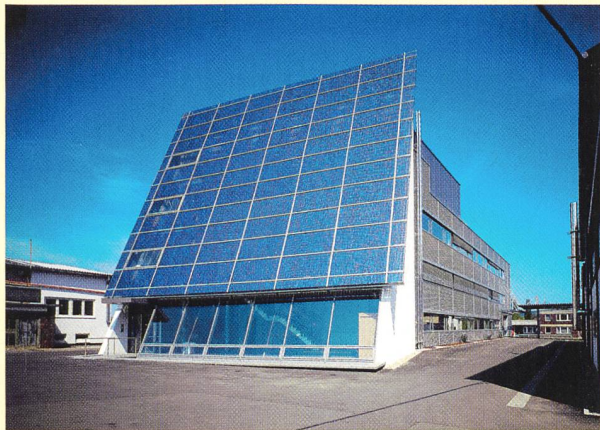
Internationale Produktion der Solarzellen steigt rasant.

Auch die Produktion der Solarzellen ist in einem rasanten Wachstum begriffen. 2002 erhöhte die Branche den Output um rund 40 Prozent. Weltmarktführer ist das Unternehmen Sharp, das gemäss der Studie die Produktion sogar um 60% steigerte und ambitionöse Ausbaupläne hegt.