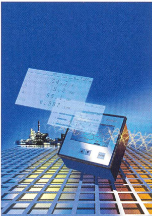
Powermeter visualisiert mehr als 80 Messgrößen.