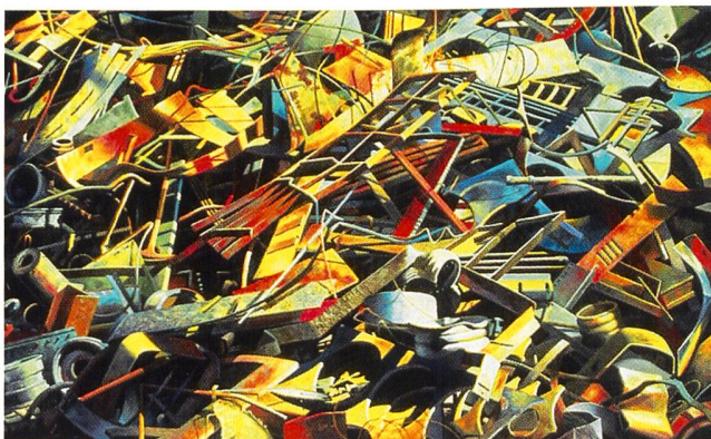
Die Aufftrennung von Elektroschrott zu rezyklierbaren Wertstoffen ist äusserst aufwändig (im Bild Metallteile).