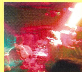
Manchmal nur viel Lärm.