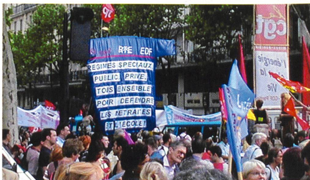
Protestmarsch der Gewerkschaften in Paris.

(d) Nach dem historischen Blackout in Italien im letzten Herbst hat die zuständige italienische Strom- und Gasbehörde (AEEG) Ermittlungen gegen mehrere Unternehmen in Italien eingeleitet. Dabei könnten unter anderem der Netzbetreiber GRN, das Stromunternehmen ENEL sowie «andere Protagonisten der italienischen Stromwirtschaft» betroffen sein. In einem ersten Bericht war im April der Schweiz die Schuld für die Strompanne zugewiesen worden.