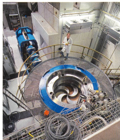
Photo de couverture: Le cyclotron du PSI, à l'intérieur duquel les protons sont accélérés depuis le centre. Cette expérience nécessite un champ magnétique très puissant. Celui-ci est produit au moyen de bobines supraconductrices, qui conduisent l'électricité sans résistance ni déperdition d'énergie. D'autres aimants (bleu) sont installés sur le sol. Ils sont utilisés pour guider les protons vers l'installation d'irradiation.

Titelbild: Zyklotron beim PSI, in dessen Innern vom Zentrum aus Protonen beschleunigt werden. Dazu ist ein sehr starkes Magnetfeld notwendig. Dieses wird mit supraleitenden Spulen erzeugt, die den Strom widerstandslos und verlustfrei leiten. Am Boden montiert sind weitere Magnete (blau), mit denen die Protonen zur Bestrahlungseinrichtung gelenkt werden.