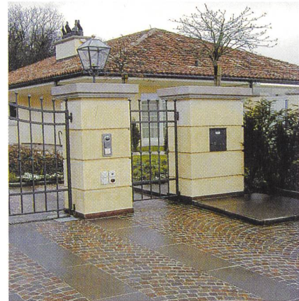
IR-Schnittstelle unauffällig beim Eingangstor.

Die Montage des IR-Fernaulesesystems ist modular aufgebaut. Das eröffnet bei der Montage vielseitige Möglichkeiten und erlaubt auch, auf die Ästhetik am Bau Rücksicht zu nehmen. So kann die IR-Schnittstelle bei der Briefkastenfront montiert werden. Auch ist die Montage an der Parzellengrenze möglich und kann