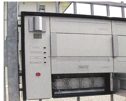
IR-Schnittstelle bei der Briefkastenfront.

somit ohne störenden Aussenzählerkasten in den Zaun oder die Aussenmauer integriert werden.