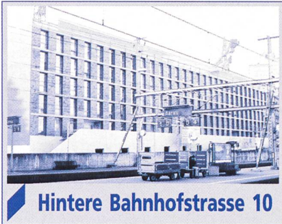
Hintere Bahnhofstrasse 10