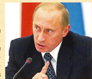
Putin erntet Lob für seine Zustimmung zum Kyoto-Protokoll.

(v) Die russische Regierung hat am 30. September 2004 dem Kyoto-Klimaprotokoll zugestimmt und dem Parlament zur Ratifikation vorgelegt. Da in der Duma vorwiegend Putin-treue Abgeordnete sitzen, gilt die Zustimmung als wahrscheinlich. 90 Tage nach Abschluss des russischen Ratifizierungsverfahrens kann das Abkommen weltweit in Kraft treten. Denn das Abkommen tritt erst in Kraft, wenn Länder ihm beitreten, die 1990 55% des weltweiten Kohlendioxidausstosses verursachten. Mit dem Beitritt Russlands, das für knapp 18% des Ausstosses verantwortlich war, sind nun rund 62% erreicht.