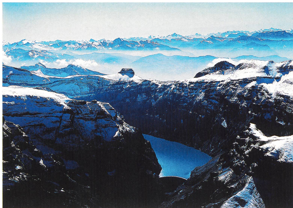
Speicheranlage Linth-Limmern (GL).

(rgl) Das Pumpspeicherprojekt Linth-Limmern erhält grünes Licht und zugleich werden die genutzten Gewässer im hinteren Kantonsteil so weit saniert, dass dem Kanton Glarus keine Entschädigungspflicht erwächst. Dies haben der Glarner Regierungsrat, Vertreter der Kraftwerke Linth-Limmern (KLL) und Umweltorganisationen vereinbart. Unter Vorbehalt des definitiven Baubeschlusses durch den Verwaltungsrat der KLL werden bei Betriebsaufnahme des Pumpwerkes voraussichtlich im Jahre