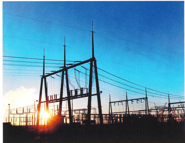
Öffnung des Strommarkts mit hoher Versorgungssicherheit und Klimaschutz gewünscht.

Am 7. Juli 2004 hat der Bundesrat die Entwürfe zum Bundesgesetz über die Stromversorgung (StromVG) und zur Revision des Elektrizitätsgesetzes (EleG) in die Vernehmlassung geschickt. Hauptziel dieser Vorlagen ist die Schaffung stabiler Rahmenbedingungen für eine sichere, nachhaltige Stromversorgung und für einen geordneten Strommarkt im sich verändernden schweizerischen und europäischen Umfeld. Zu den beiden Vorlagen sind insgesamt rund 150 Stellungnahmen eingegangen, die nun im Detail ausgewertet werden. Erste Analysen zeigen, dass insbesondere Kantone, Städte und Gemeinden den vorgeschlagenen Kompromiss für die Regelung des Strommarktes begrüßen. Vielfach befürwortet werden das etappierte Vorgehen, die Massnahmen zum Schutz der Kleinverbraucher und die Angleichung der schweizerischen Vorschriften an die europäischen Richtlinien zum grenzüberschreitenden Stromhandel. Die Stellungnahmen aus der Strombranche sind kontrovers und reichen von einer weit gehenden Zustimmung bis zur völligen Ablehnung der Vorlage. Eine verstärkte Förderung der erneuerbaren Energien wird von den Vernehmlassern nicht grundsätzlich in Frage gestellt, einige