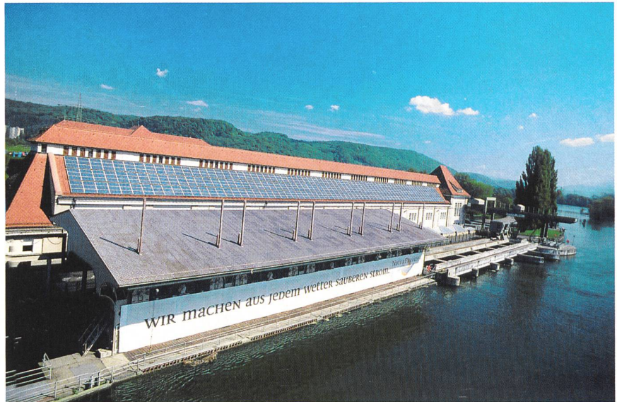
Alle EU-Staaten, auch solche, die wie die Schweiz dank Wasserkraft bereits einen hohen Anteil an umweltfreundlichen Anlagen vorweisen können, haben sich zu einer Steigerung bei der Elektrizitätsproduktion aus Erneuerbaren verpflichtet (Wasserkraftwerk am Rhein mit Photovoltaikdach).

Seit 1994 werden in Irland periodisch Ausschreibungen durchgeführt. Ein in Grossbritannien praktiziertes Modell wurde wieder verlassen, weil es mit mehreren Unzulänglichkeiten wie viel zu kurzer Laufdauer und damit zu hohen Preisen behaftet war.