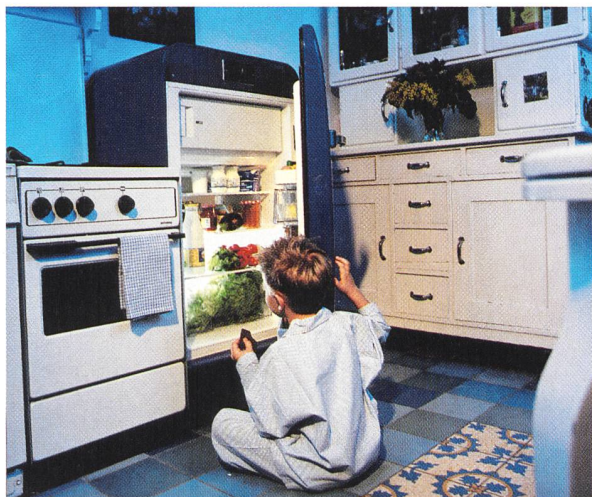
Die nachgefragten Mengen von Ökostrom machen nur wenige Prozent des Haushaltsstrombedarfs aus.

in den Wettbewerb, so werden die geringsten Kosten entstehen.