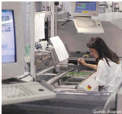
Electronic Manufacturing Services (EMS): Nelm und Altimex fusionieren zur Adaxys.

Die Firmen Nelm SA in Mendrisio (TI) und Altimex in Altendorf (SZ) fertigen Elektronik für Firmen, die dies outsourcen wollen. Sie bieten so genannte Electronic Manufacturing Services (EMS) an. Die bei-