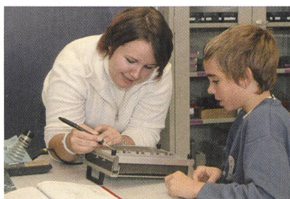
Un écolier s'initie à l'électronique avec l'aide d'une collaboratrice de l'école

Une action ETGAR (qui a pour but la promotion des métiers de l'électricité) a eu lieu à l'Ecole d'ingénieurs et d'architectes de Fribourg (EIF) les 18 et 19 octobre 2004.