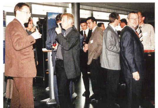
Angeregter Erfahrungsaustausch während den Pausen.

Die vom Verband Schweizerischer Elektrizitätswerke VSE in Auftrag gegebene Video-Umfrage in den Strassen von Biel und Thun zeigte deutlich, dass die Leute positiv zu Ökostrom stehen, jedoch nicht wissen, wie solcher bestellt werden kann. Natürlich sollte der Preis nicht höher als «normaler» Strom sein.