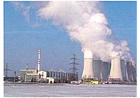
Centrale nucleare de Bohunice (4 x 440 MW).

(en) Il ministro slovacco dell'Economia Pavol Rusko e l'amministratore delegato di Enel Paolo Scaroni hanno firmato il contratto per l'acquisto da parte di Enel, per 840 milioni di euro, del 66% della società elettrica Slovenské Elektrárne (SE), il maggior produttore di energia elettrica della Slovacchia e il secondo dell'Europa Centro-orientale. SE attualmente gestisce circa 7000 MW (83% della capacità della Slovacchia), una potenza pari alla più grande delle tre Genco che Enel ha dovuto cedere in Italia per favorire il processo di liberalizzazione. SE dispone di un parco impianti ben bilanciato tra termico, idraulico e nucleare che garantisce una pro-