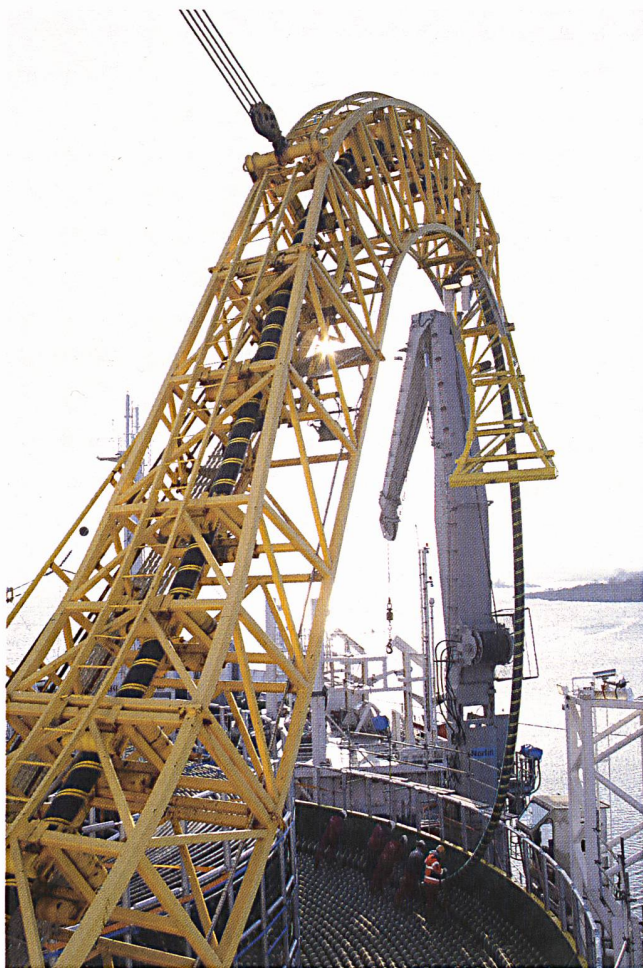
100 km Kabel sollen in der Ostsee gelegt werden.

ABB hat den Zuschlag bei der öffentlichen Ausschreibung für die Konstruktion, den Bau und die Installation einer neuen Stromleitung zwischen den Stromnetzen Finnlands und Estlands bekannt gegeben. Das Projekt hat einen Wert von $110 Millionen. Das Estlink-Projekt wird die erste Stromverbindung der EU mit einem der neuen Mitgliedsländer seit der EU-Erweiterung Mitte 2004 sein. ABB rechnet mit einer baldigen EU-Genehmigung, da sie Teil der von der EU genehmigten Prioritätenliste für das transeuropäische Stromnetz ist.