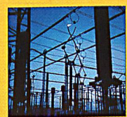
Gestaltung von Sonderverträgen und Ausschreibung von Stromlieferungen