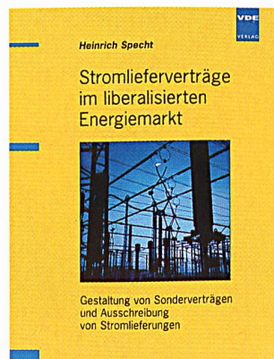
Heinrich Specht Stromlieferverträge im liberalisierten Energiemarkt