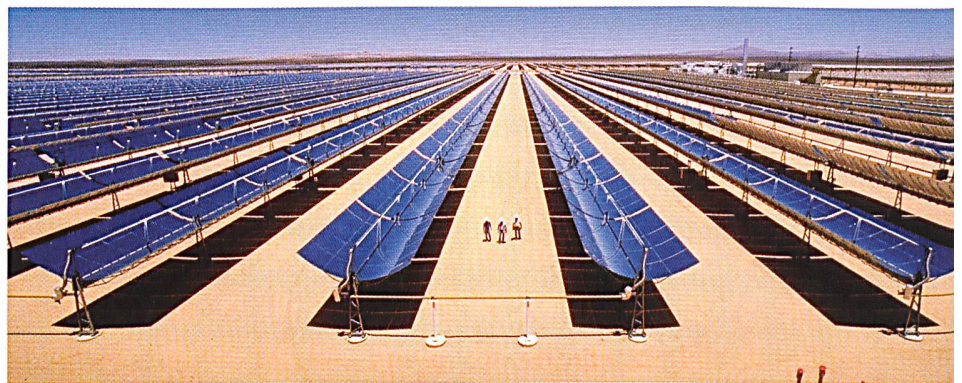
Schon heute produzieren die solarthermischen Kraftwerke in der kalifornischen Mojave-Wüste den günstigsten Solarstrom weltweit. Das Bild zeigt Parabolrinnenkollektoren, die Hochtemperaturwärme von 390 Grad Celsius erzeugen. Damit wird ein konventionelles Dampfkraftwerk betrieben.

Für die Partner aus Industrie und Forschung ist es wichtig, dass die Forschung auf dem Gebiet der solarthermischen Kraftwerke eine hohe Priorität bei dem zurzeit verhandelten siebten Europäischen Forschungsrahmenprogramm erhält. Vertreter der EU-Kommission erkannten bei der Präsentation der Studie in der nordrhein-westfälischen Landesvertretung in Brüssel an, dass das ECOSTAR-Konsortium wesentliche Vorarbeiten für die Schaffung einer europäischen Technologieplattform für solarthermische Kraftwerke erarbeitet hat.