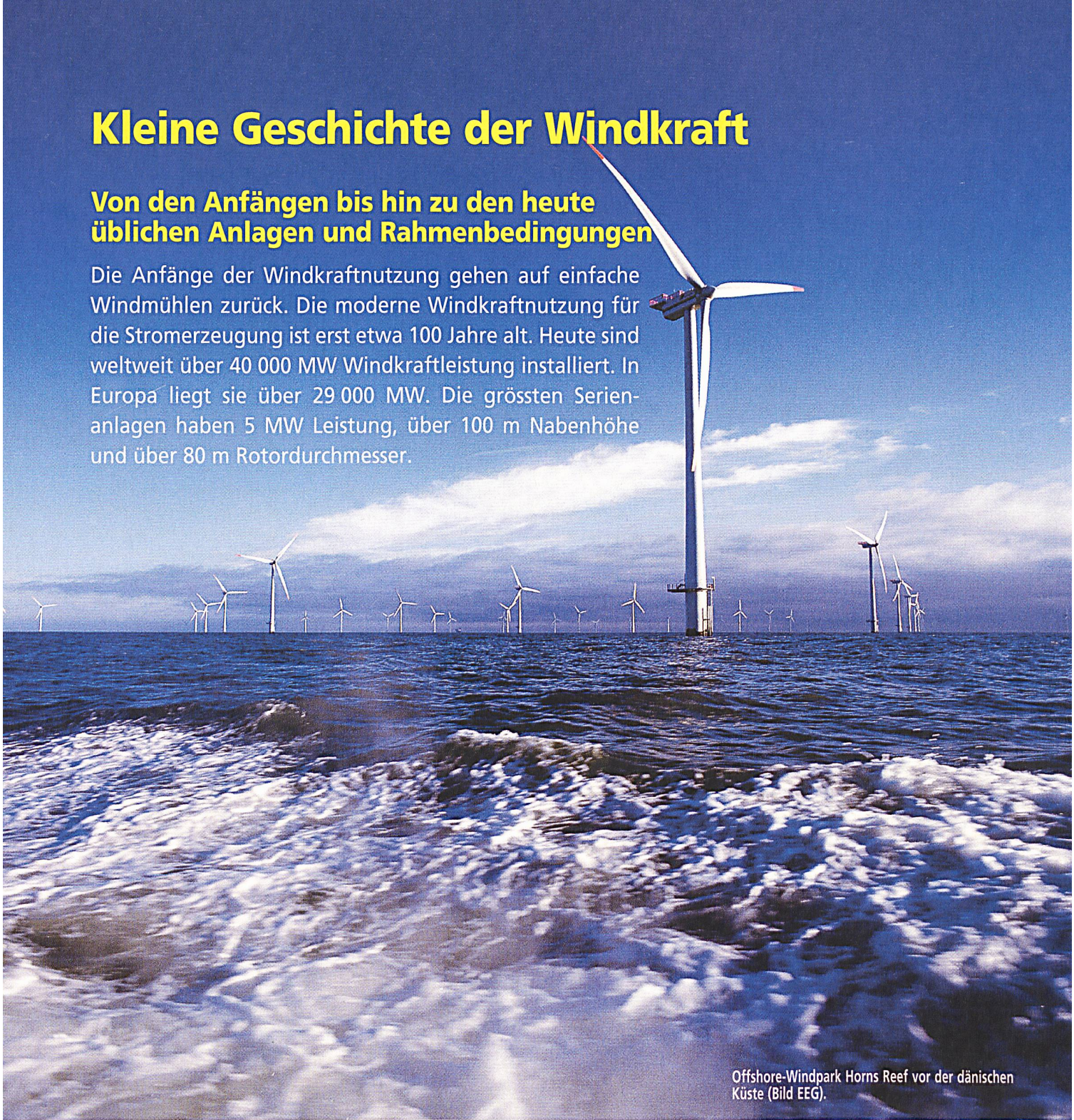
Offshore-Windpark Horns Reef vor der dänischen Küste.

Die Anfänge der Windkraftnutzung gehen auf einfache Windmühlen zurück. Die moderne Windkraftnutzung für die Stromerzeugung ist erst etwa 100 Jahre alt. Heute sind weltweit über 40 000 MW Windkraftleistung installiert. In Europa liegt sie über 29 000 MW. Die grössten Serienanlagen haben 5 MW Leistung, über 100 m Nabenhöhe und über 80 m Rotordurchmesser.