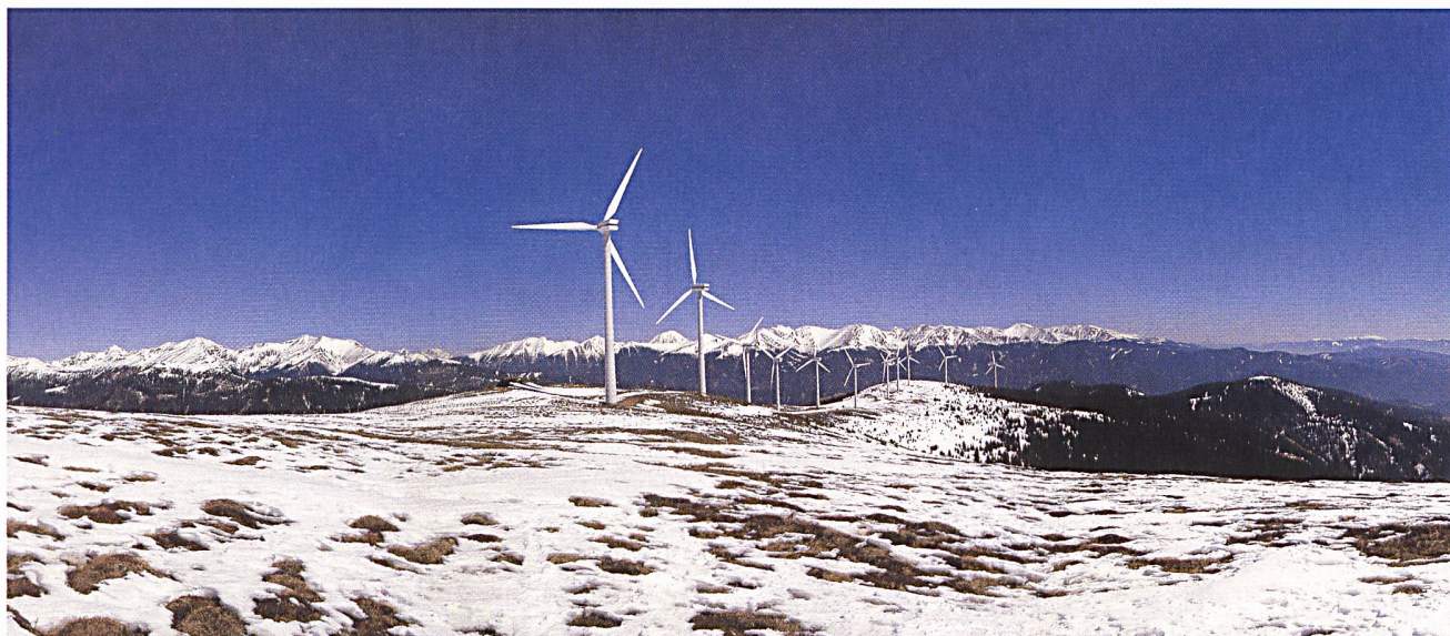
Tauernwindpark Oberzeiring (Österreich) im März.