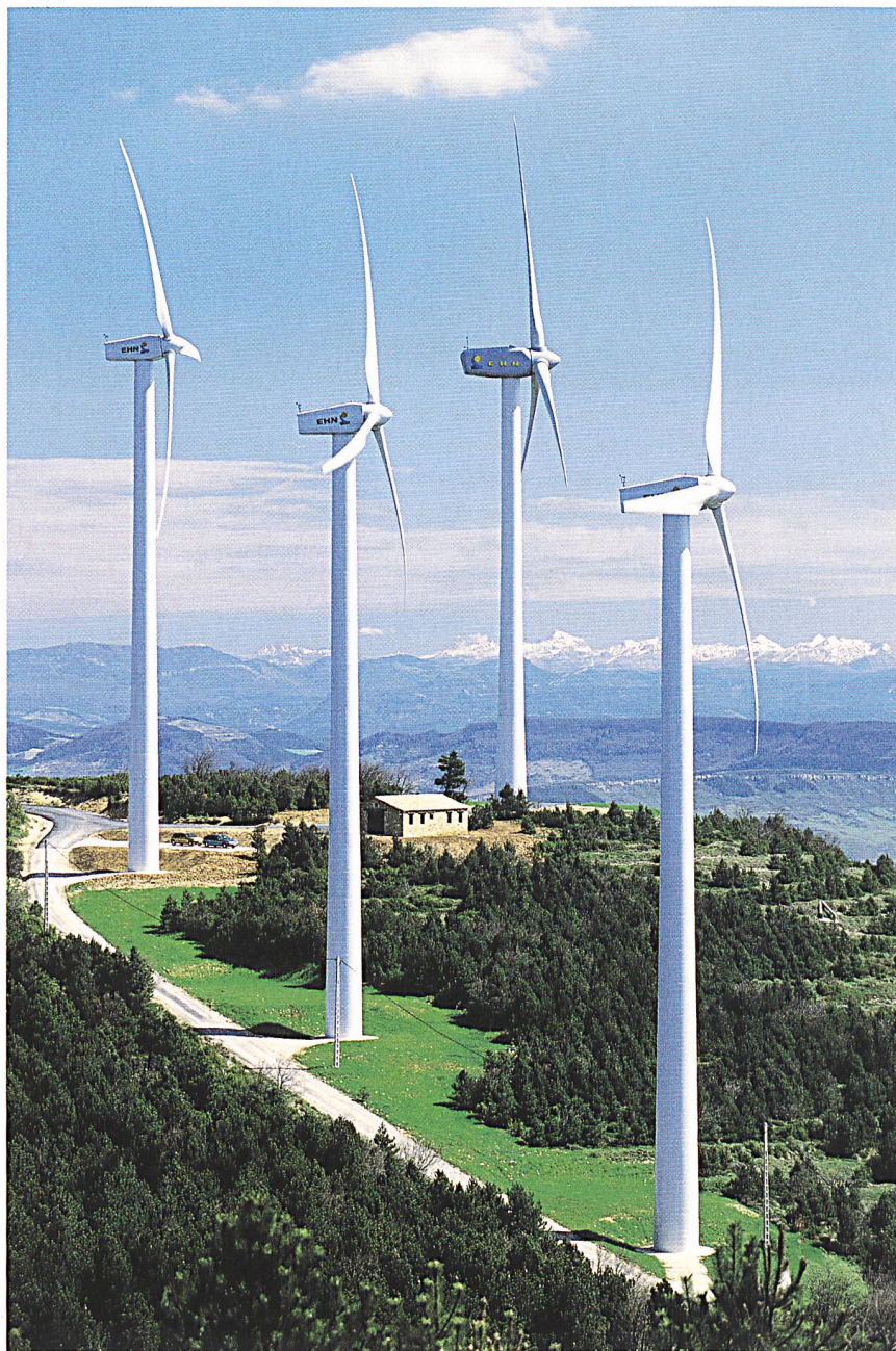
Windpark Aizkibel (Spanien).

In den USA konnten nach einer Flaute im Jahr 2002 (494 MW) wieder Neuinstallationen von 1687 MW verzeichnet werden. Auch Asien erlebte eine Steigerung von 89% im Vergleich zum Vorjahr. Die neu installierte Leistung stieg von 424 MW auf 804 MW. In den anderen Kontinenten ist die Leistung aus Windenergieanlagen um 175 MW auf 605 MW angewachsen. So haben z.B. Australien und Neuseeland ihre Kapazitäten um insgesamt 70 MW auf 294 MW und Nordafrika um 63 MW auf 211 MW erhöht.