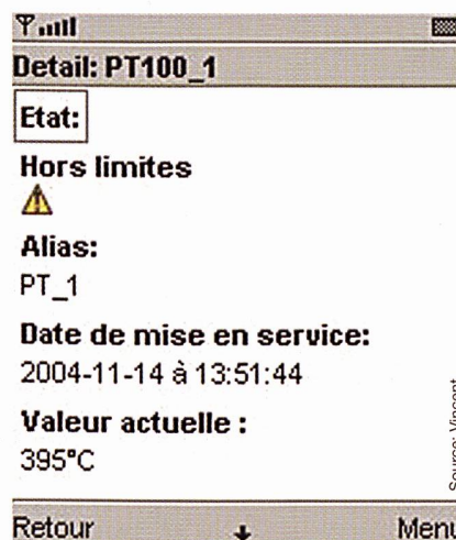
Figure 3 Etats de fonctionnement

Un grand problème des systèmes portables légers est la taille de leur écran et de leur mémoire ce qui limite la complexité de l'interface graphique et par conséquent sa convivialité. Une autre difficulté à gérer est la sécurité. En effet, on désire contrôler les personnes pouvant interagir avec la chaîne de production et contrôler également leur degré de maîtrise.