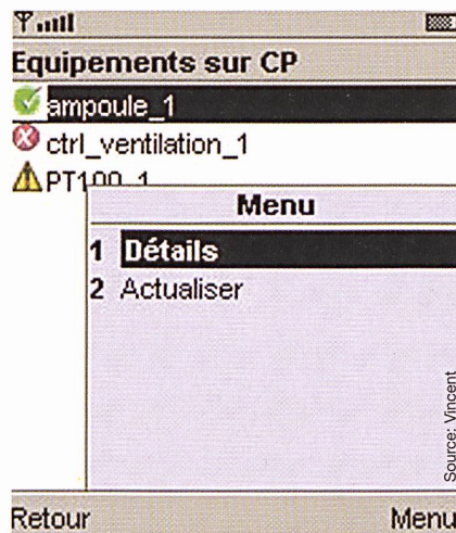
Figure 4 Informations détaillées

Le mécanisme de réveil de l'application nous permet également de jouer un fichier son qui ne s'arrêtera que sur l'ordre de l'utilisateur contrairement aux