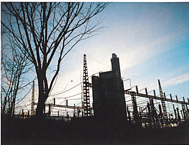
«Nicht auf ein Blackout warten»: 1000 Mrd. Euro für Kraftwerke und Netze notwendig?

(a) Um die Stromversorgung in Zukunft sicherzustellen, brauche die Europäische Union in den nächsten 25 bis 30 Jahren rund 1000 zusätzliche Grosskraftwerke. Gemäss Eurelectric-Präsident Hans Haider betrage der geschätzte Leistungsbedarf für alle 25 heutigen EU-Staaten in der genannten Zeitperiode 750 000 Megawatt. Die Kosten für alle zusätzlichen Kraftwerke schätzt Haider auf 500 Mrd. Euro, ebenso hohe Investitionen seien für die Netze erforderlich. Die Hälfte des genannten Bedarfs sei notwendig, um den wachsenden Konsum in Europa zu decken, sagte