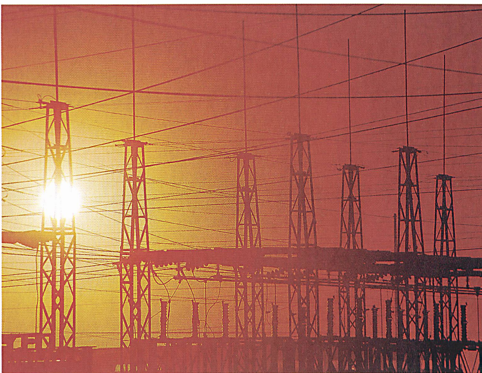
Zugang zum Höchstspannungsnetz.

Laut der Erhebung gibt es kein Stromerzeugungssystem, das immer am günstigsten abschneidet. Im Vergleich zu den früheren Studien deutlich aufgeholt hat indessen die Kernenergie. Sie ist jetzt oft klar die wirtschaftlich interessanteste Lösung zur De-