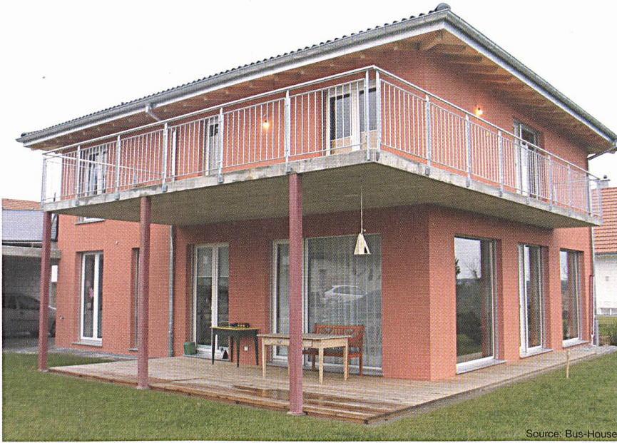
Figure 2 Maison spacieuse avec un emplacement idéal au bord d'un versant, grande terrasse et abri-voiture équipé de collecteurs solaires sur le dessus

lieux: un petit coin de détente avec un poste de télévision, de la musique et des livres. Au rez-de-chaussée on trouve une grande salle de séjour-salle à manger avec de larges fenêtres, une cuisine ouverte, une pièce de travail et un bureau spacieux. Le sous-sol couvre, lui, une large surface compartimentée en cave à vins, buanderie, atelier et débarras à éclairage naturel. Un abri-voiture et un abri-vélo complètent l'aménagement.