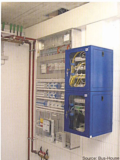
Figure 3 Wago System 750 avec bornes d'entrée/de sortie et connecteur Ethernet dans le système de distribution électrique (à gauche), coffret 9.5" comme centrale de communication (à droite)

La technique radio communique par le biais d'un récepteur-émetteur bidirection-