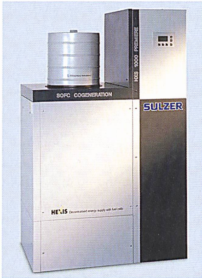
Siemens-Westinghouse 100-kW-SOFC Modul.