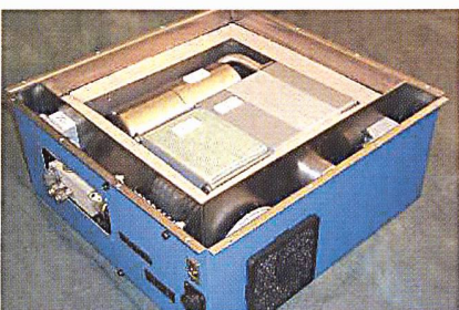
SOFC Auxiliary Power Unit (APU).

Einige der amerikanischen Entwickler werden von der Regierungsinitiative SECA (Solid State Energy Conversion Alliance) unterstützt, die speziell die Baugrößen 3 bis 10 kW fördert. In Kanada entwickelt Fuel Cell Technologies (5 kW) Keramikzellen, und in Australien ist Ceramic Fuel Cells (0,5 bis 200 kW) auf dem Gebiet tätig. Hinzu kommen zahlreiche Universitäten und Institute weltweit. Erkennbar ist bei kleinen SOFC ein Trend zur Mitteltemperatur, das heisst deutlich unter 900 °C. Einer der Vorteile ist die kürzere Aufheizzeit.