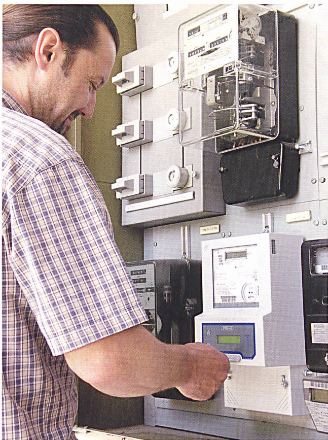
Bild 2 PMS-400 in der Praxis: Einsatz des PMS-400-Systems in der Messung eines Restaurants. Durch einfaches Stecken seiner Karte kann der Kunde jederzeit sein Restguthaben kontrollieren.

Workshop mit allen Anwendern über das gesamte Themenspektrum hinweg (Inkassoprozess und Systembedienung), stellte sich als problematisch heraus.