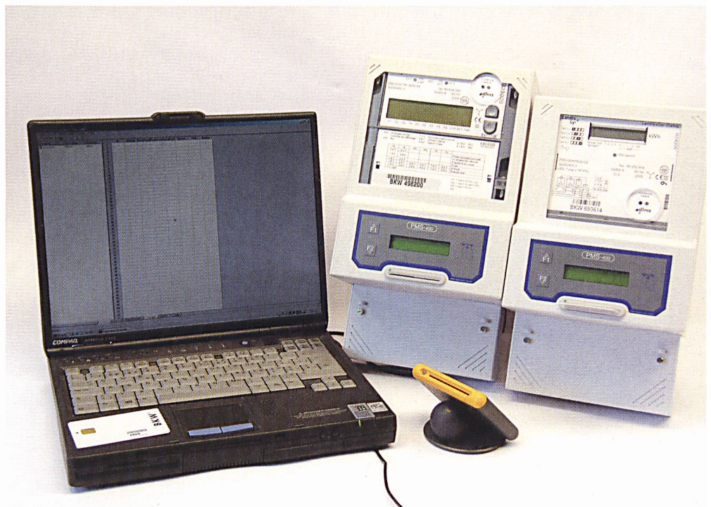
Bild 1 Systemkomponenten.

Parallel zur technischen Einführung und der Anwenderschulung sollte auch der bis dahin in den Regionalvertretungen unterschiedlich gelöste Inkassoprozess vereinheitlicht werden. Es nahm viel Zeit in Anspruch, diesen Prozess zu erstellen. Die Anwenderschulung in den Regionalvertretungen wurde schliesslich von Frühling bis Herbst 2004 durchgeführt. Die gewählte Art der Schulung, eine Mischung aus Frontalunterricht und