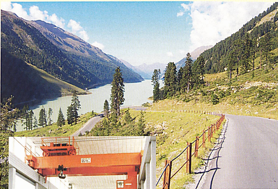
Gepatsch-Stausee im Kaunertal.