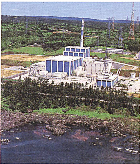
Centrale nucléaire japonaise de Shika.

(nf) La centrale nucléaire japonaise de Shika 2 a livré pour la première fois de l'électricité au réseau le 4 juillet 2005. Sa