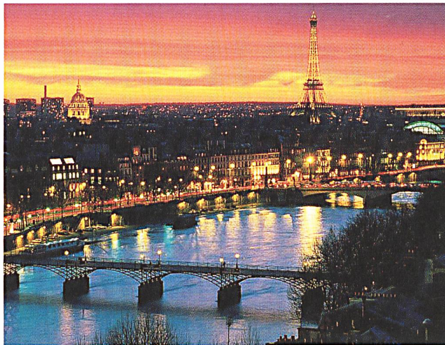
Frankreich erreichte die Höchstlast am 22. Dezember um 19.00 Uhr (Paris).

(eu) Die Europäische Investitionsbank (EIB) finanziert Vorhaben des öffentlichen Nahverkehrs auf eigener Trasse, um die nachhaltige Stadtentwicklung zu unterstützen. Dabei geht es darum, die Umweltbelastung zu verringern und die Lebensqualität in den städtischen Gebieten zu verbessern und parallel dazu die Wirtschaftsentwicklung der Städte zu fördern. In diesem Zusammenhang hat die EIB von 2000 bis Ende 2004 den Ausbau des städtischen Nahverkehrs in der gesamten Europäischen Union mit mehr als 10 Mrd. Euro unterstützt. Sie beteiligte sich an der Finanzierung von U-Bahnen und Strassenbahnen u.a. in Athen, Alicante, Barcelona, Bilbao, Brüssel, Berlin, Valencia, Lissabon, London, Madrid, München, Düsseldorf, Manchester, Dublin, Budapest und Prag. In Frankreich hat die EIB zahlreiche Projekte im Bereich des öffentlichen Nahverkehrs unterstützt, insbesondere in Bordeaux, Lyon, Montpellier, Mulhouse, Nancy, Nantes, Orléans, Rennes, St. Etienne, Strassburg, Toulouse und Valenciennes. Hierfür hat sie in den letzten fünf Jahren insgesamt 2,5 Mrd. Euro zur Verfügung gestellt.