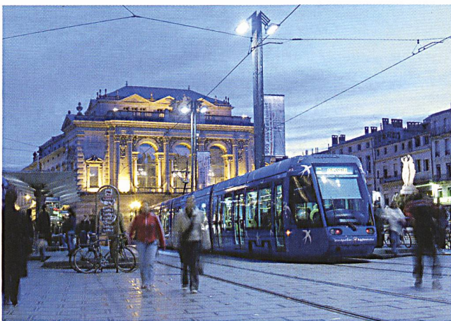
10 Mrd. Euro für den Ausbau des städtischen Verkehrs (Tram in Montpellier).