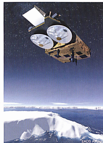
Une animation du satellite Cryosat

D'une altitude de 740 km, Cryosat mesurera par radar l'épaisseur et la surface des glaces. La mesure sera double, pour permettre une vision stéréoscopique du relief. Les mesures radar fonctionnent aussi en cas de couverture nuageuse. Cryosat réalise la 1 ère mission d'exploration terrestre du programme «Planète vivante» décidé en 1998 par l'ESA. (JFD)