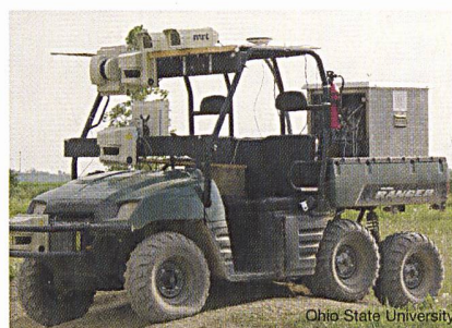
La voiture de l'Université de Karlsruhe, développée en partenariat avec l'Ohio State University

La course automobile «Grand challenge» passe pour une des plus difficiles de sa catégorie et traverse 300 km de désert entre Los Angeles et Las Vegas (Californie). Il n'y a cependant pas de défaillances humaines possibles, les bolides étant pilotés par des robots. Pour