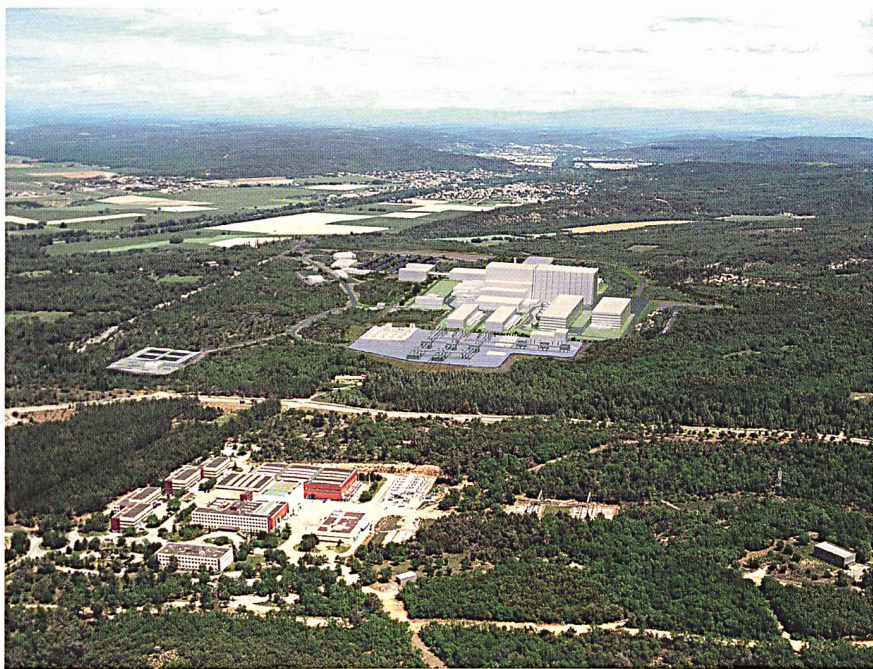
Futur site d'ITER à Cadarache (montage photo).

Les partenaires d'ITER ont choisi Cadarache, en France, pour accueillir le réacteur expérimental de fusion nucléaire, un programme de 10 milliards d'euros sur trente ans. Cette décision fournit de formidables opportunités au Centre de recherche en physique des plasmas (CRPP) de l'EPFL, en vue de déboucher sur une nouvelle source d'énergie propre.