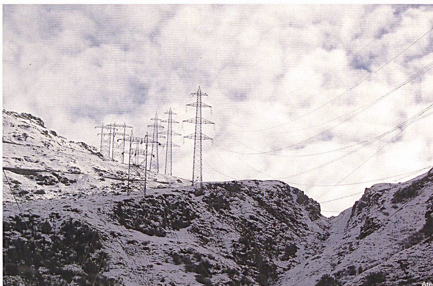
Bild 3 380-kV-Leitung über den Nufenenpass

Zu sehen ist die neue 380-kV-Leitung über den Nufenenpass kurz vor der Vollendung. Die Leitung wurde in den letzten beiden Jahren zwischen All'Acqua im Bedrettetal und Ulrichen im Goms im Kanton Wallis neu erstellt. Daneben ist auch die bestehende 220-kV-Stromleitung zu erkennen, welche Innertkirchen mit den Maggiawerken im Tessin verbindet.