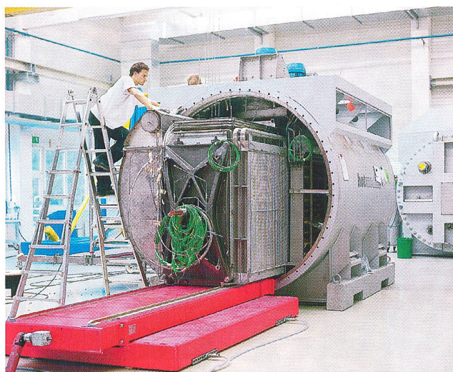
Produktion HotModule (Bilder MTU).