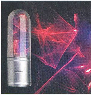
Wunderbare Lichtspiele mit dem Laserpod realisiert.