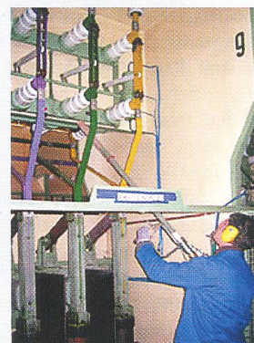
Prototyp der Reinigungsanlage für spannungsführende Anlagen.

Das Fraunhofer-Institut für Produktionsanlagen und Konstruktionstechnik IPK in Berlin hat gemeinsam mit dem Institut für Werkzeugmaschinen und Fabrikbetrieb IWF der TU Berlin und dem Lehrstuhl für Hochspannungstechnik der Brandenburgischen Technischen Universität ein Reinigungsgerät auf Basis von Trockeneispellets entwickelt, das auch bei einer Spannung von bis zu 30 000 Volt den Schmutz beseitigt ohne gefährliche Spannungsüberschläge. Der Clou dieser Lösung sind neu konzipierte Strahldüsen und eine Lanzen- und Anlagentechnik, die optimalen Schutz für Mensch und Maschine bietet.