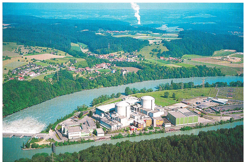
Les installations nucléaires suisses ont été maintenues en bon état et exploitées correctement dans un objectif de sûreté.

(hsk) Die schweizerischen Kernanlagen waren 2005 in gutem Zustand und verfügten über eine korrekte und sicherheitsgerichtete Betriebsführung. Die nukleare Sicherheit war somit auch im Jahr 2005 gewährleistet. Dies stellt die Hauptabteilung für die Sicherheit der Kernanlagen (HSK) in ihrem Rückblick auf das vergangene Jahr fest. Die HSK klassierte 14 Vorkommnisse (Vorjahr: 8) in den fünf Kernkraftwerken sowie 2 Vorkommnisse (Vorjahr: 1) im Paul Scherrer Institut. Der Strahlenschutz war für das Personal und die Bevölkerung jederzeit gewährleistet, und die gesetzlichen Vorgaben wurden eingehalten. Die HSK hat sich davon überzeugt, dass die fünf Kernkraftwerke Beznau (Block 1 und 2), Mühleberg, Gösgen und Leibstadt in einem sicherheitstechnisch guten Zustand sind und ein sicheres Betriebsverhalten aufweisen.