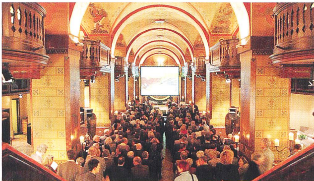
Traditioneller Apéro des Bundesamtes für Energie im Kornhauskeller.