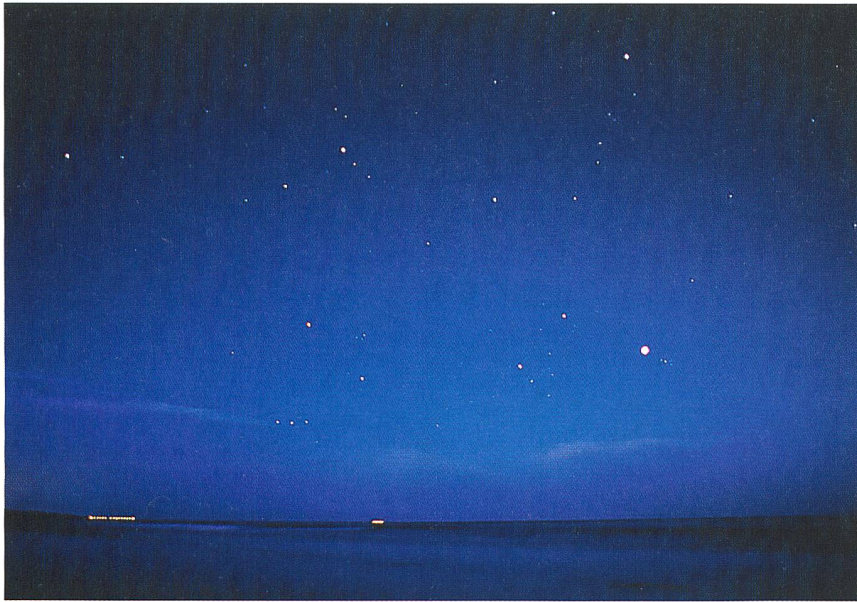
Verschwimmt der sichtbare Sternenhimmel?

zu sensibilisieren. Die in dieser Publikation gemachten Empfehlungen folgen einem einfachen Prinzip: Licht soll nur dorthin gelangen, wo es der Mensch auch braucht. Licht in Richtung Himmel oder in ökologisch sensible Lebensräume zu strahlen, nützt niemandem, sondern verbraucht unnötig Energie, schadet anderen Lebewesen und entwertet das Landschaftserleben. Dies bedeutet: