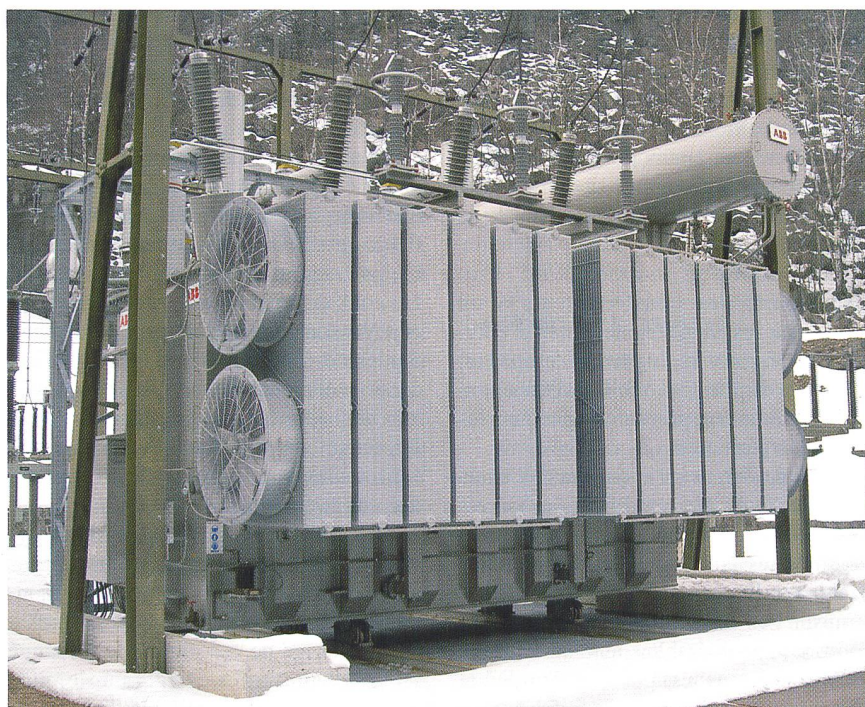
Figure 1 Transformateur AET-250MVA de la Centrale Piottino (Tessin)