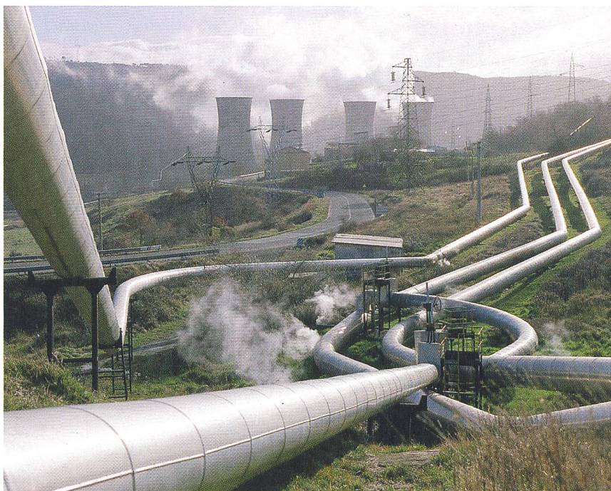
Die grösste geothermische Anlage Europas liegt südlich der Schweiz in der Toskana (Larderello/Italien).