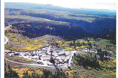
Fenton Hill HDR Test Site (Los Alamos, New Mexico, USA), weltweit erste HDR-Testanlage.

International cooperation is the hallmark of HDR research and development and Geodynamics is well placed to directly benefit from this co-operation, without having to «reinvent the wheel». The most advanced HDR projects is being developed in France (Saultz, Le Mayet) and Japan (Hijiori, Ogachi), whilst new projects are being initiated in Germany (Falkenberg, Bad Urach) and Switzerland (Basel, Geneva).