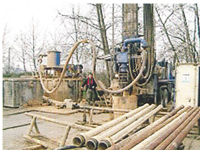
Horchbohrungen bei Basel.

zur Strom- und Wärmegewinnung (z.B. die Pilotanlage in Soultz-sous-Forêts im Elsass; ein entsprechendes Schweizer Projekt gibt es in Basel)