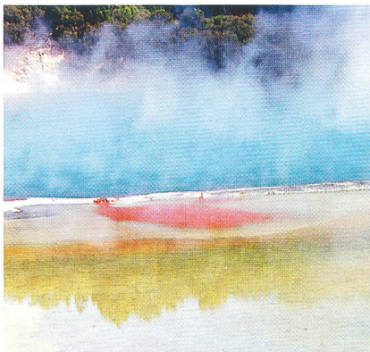
Geothermisches Becken in Neuseeland.