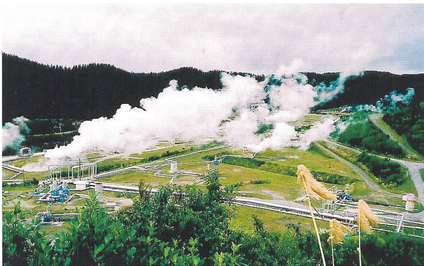
Geothermisches Kraftwerk Weirakei (Neuseeland).

an die Erdoberfläche zu befördern. An einigen Stellen liefert die Natur selbst das notwendige Zirkulationssystem (z.B. Thermalquellen). Anderswo müssen Erschließungsbohrungen mit Förderpumpe beziehungsweise Erdwärmesonden mit Zirkulationspumpe eingesetzt werden.