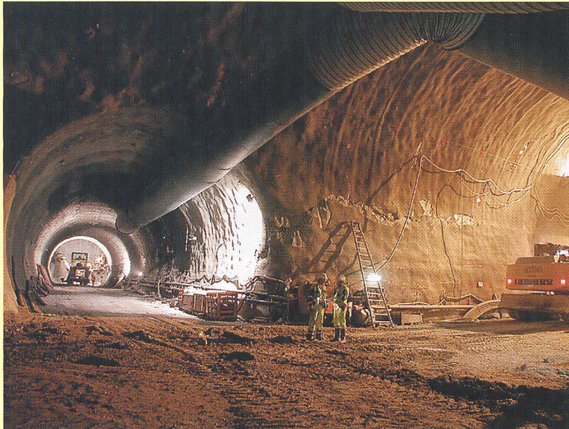
Neat-Tunnel bei Faido: Auch der neue Gotthard-Basistunnel wurde auf geothermische Quellen untersucht. Forscher vermuten ein Wärmeleistungspotenzial von 15 bis 25 MW (Bild: Alptransit).

(eth) Die Schweiz ist mit mehr als 700 Eisenbahn- und Strassentunnels eines der tunnelreichsten Länder der Welt. Da die Tunnel gleichsam eine «Drainage» des durchbohrten Gebirges bewirken, lassen sich die in Tunnelröhren einsickernden warmen Kluftwässer sammeln und nutzen. Alleine das Wärmeleistungspotenzial der 15 geothermisch interessantesten Schweizer Bahn- und Strassentunnels beträgt knapp 30 Megawatt (MW). Mit 11,7 MW am meisten Potenzial hat der Eisenbahntunnel Grenchenberg, gefolgt vom Gotthard-Strassentunnel (4,5 MW) und vom Furka-Tunnel (3,8 MW).