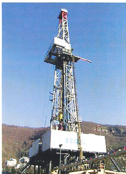
Bohrturm der Pilotanlage Bad Urach (Süddeutschland).