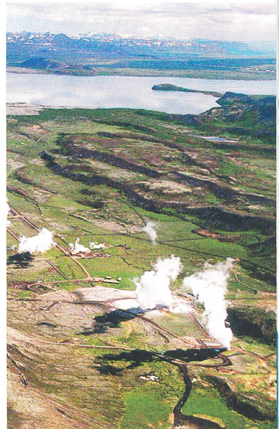
Geothermisches Kraftwerk Nesjavellir (Island).

sung des unterirdischen Wärmereservoirs und registrieren nebenbei auch natürliche Erdschütterungen, die an der Erdoberfläche nicht wahrnehmbar sind. Der schweizerische Erdbebendienst wie auch die amerikanische Forschergruppe, die die Technologie entwickelt hat, werden direkten Zugriff auf die Messergebnisse erhalten.