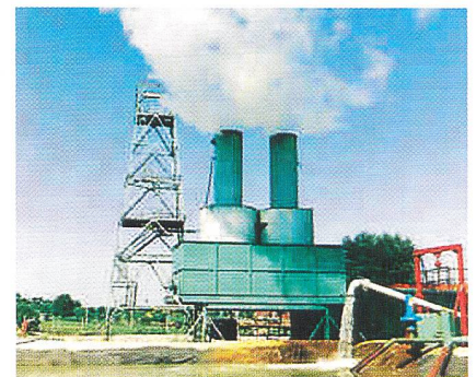
Pilotanlage in Soultz-sous-Forêts im Elsass (Frankreich).

Rapide voran geht es vor allem in den Vereinigten Staaten selbst. Allein 2005 konnten für 500 neu geplante MW Stromlieferverträge abgeschlossen werden. Weitere stehen für 2006 an. In elf westlichen Bundesstaaten wurden auf Initiative der Gouverneursvereinigung neue Felder und Kraftwerksstandorte identifiziert. Auf den Philippinen sollen in den nächsten vier Jahren 500 bis 700 MW neu in Betrieb genommen werden. Die Zielvorgabe liegt bei 10 000 MW aus geothermischen Ressourcen, von denen bis 2010 rund 2000 MW Strom liefern werden. Ähnlich sieht die Situation in Indonesien aus. Derzeit sind dort 800 MW am Netz. Bis 2009 sollen 1200 MW hinzukommen. In Island entstehen derzeit eine Reihe neuer Kraftwerke. Neue Anlagen wurden in Neuseeland und Nicaragua auf den Weg gebracht. Als neue Spieler im geothermischen Stromorchester kommen in Kürze Kanada und Indien hinzu. Auf dem Subkontinent stehen geo-