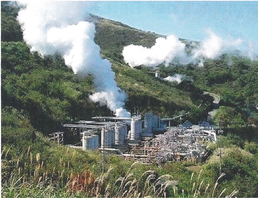
Geothermisches Kraftwerk Hatchobaru (Japan).